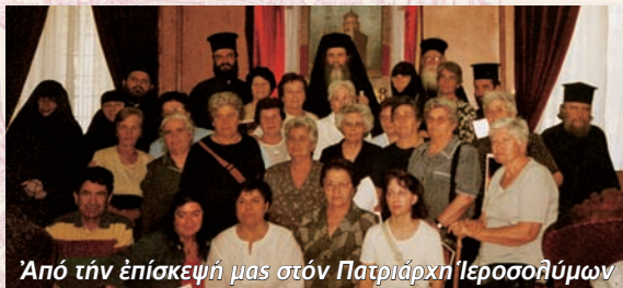
Ἀπὸ τὴν ἐπίσκεψή μας στὸν Πατριάρχη Ἱεροσολύμων