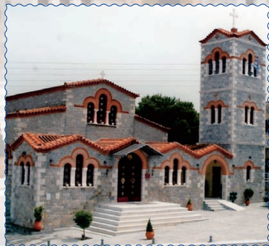
Ό Ναός τής Ένορίας μας

ὁποῖες προσκαλούμαστε νά συμμετέχουμε μέ πίστη καί εὐλάβεια, γιά νά ἐναποθέσουμε στόν Θεό τά ὑλικά καί πνευματικά αἰτήματά μας. Οἱ Ἀκολουθίες ἀκόμη μās ξυπνοῦν τήν ψυχική ἐπιθυμία πού ἔχουμε ὡς ἄνθρωποι νά δοξολογήσουμε καί νά ὑμνήσουμε τόν Χριστό μας.