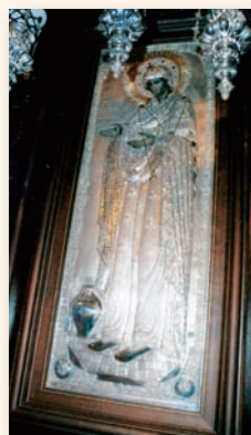
Ἡ Παναγία «Γερόντισσα». Βρίσκεται ἐντός τοῦ Ἰ. Βήματος.

Ἀποτελεῖ ἰδιαίτερη εὐλογία καί γιά τούς ἄνδρες καί γιά τίς γυναῖκες, ἡ θητεία ἔστω γιά μία τριετία στό Ἐκκλ. Συμβούλιο τῆς Ἐνορίας μας.